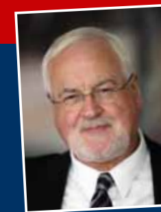
Dr. h. c. Peter Harry Carstensen Vorsitzender